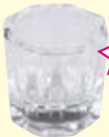
Dappenglas klar, zum Mischen von Wimpernfarbe Art-Nr. 0458