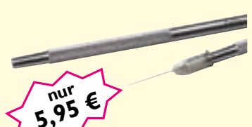
Kanülenhalter für Einmalkanülen Art-Nr. 05460 6,95 € netto