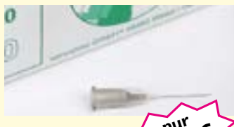
Einmalkanüle, 100 Stck. Nr. 20, steril, zum Entfernen von Milien Art-Nr. 0546