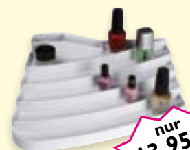
Produktständer LxBxH 285x220x90 mm Art-Nr. 500545