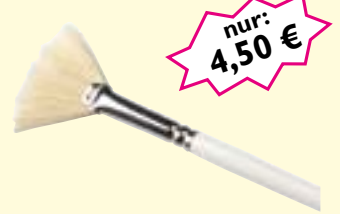
Fächerpinsel Naturborste, L: 200 mm Art-Nr. 0427