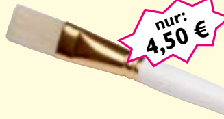
Maskenpinsel Naturborste, L: 190 mm Art-Nr. 0428