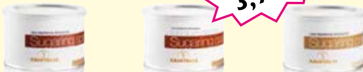
0115-Spatula für Vliesstreifen