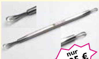
Komedonenheber doppelseitig, rostfrei Art-Nr. 04730