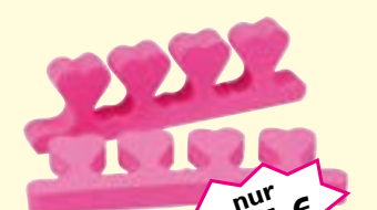
Lackierhilfe Zehenkamm Art-Nr. 0499