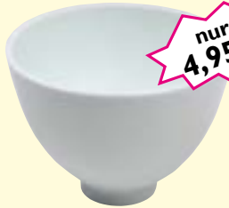
Maskenschale, weiß 400 ml, flexibel Art-Nr. 04350