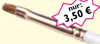
Wimpernfärbepinsel Toray-Haar, L: 165 mm Art-Nr. 0429