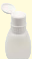
Pump-Dispenser, 240 ml Art-Nr. 0441