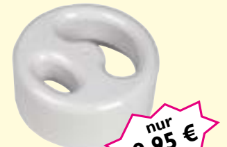
Maniküre-Schale Art-Nr. 0464