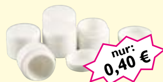
Probendose, 5ml doppeltwandig, Abdeckkappe und Schraubdeckel, Abb. ähnlich Art-Nr. 50056