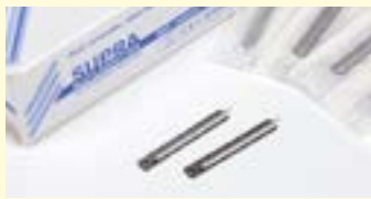
Blutlanzetten, 200 Stck. Entfernen von Komedonen Art-Nr. 0466