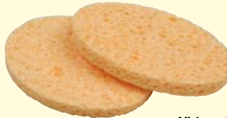
Viskose-Schwamm, 2er, oval, LxB 120x95 mm Art-Nr. 0420