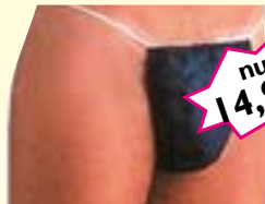
Vlies-Tanga, Herren 50 Stk. Art-Nr. 0468