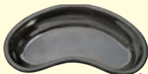
Nierenschale rostfrei, LxH 17x37 mm Art-Nr. 0500