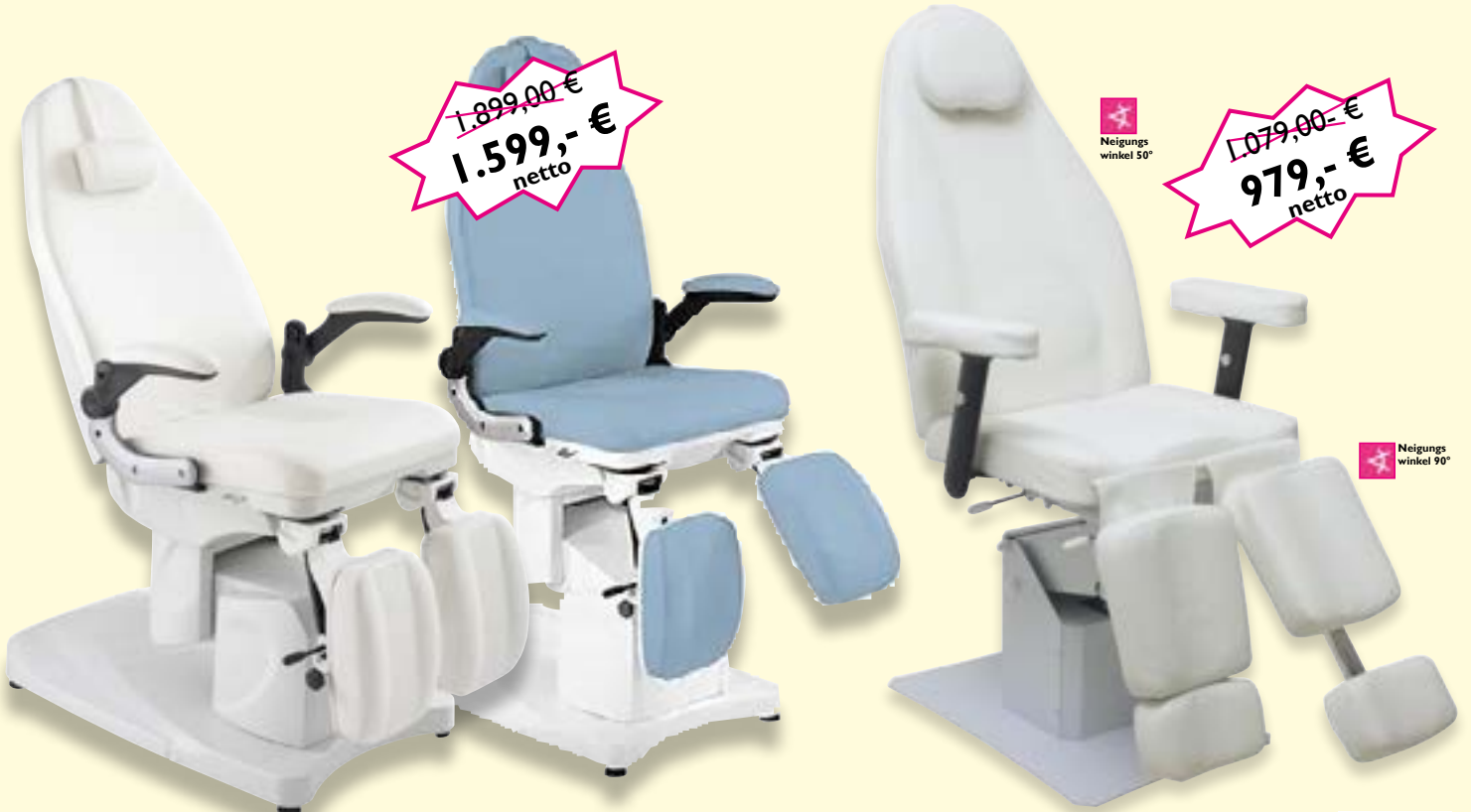
Fußpflegeliege „Armando“ Art-Nr. 30300 weiß 30306 blau