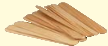
Holzspatel 100 Stk., L: 150 mm Art-Nr. 0439