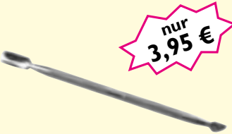
Gelspatel Schieben der Nagelhaut, Gel- und Acrylreste, lösen der Tip's, Art-Nr. 50067