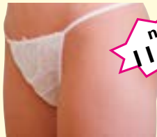
Vlies-Tanga, Damen 50 Stück Art-Nr. 0467