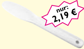
Maskenspatel 1 Stk, L: 115 mm Art-Nr. 04400